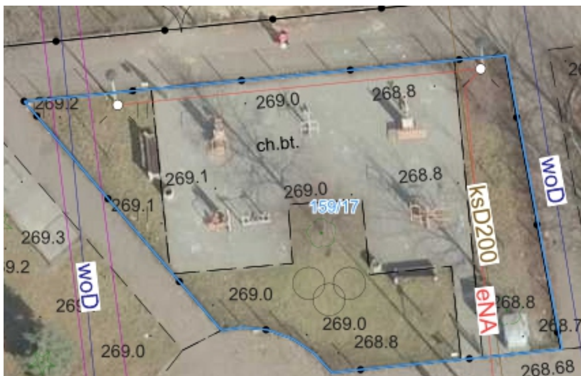
Zdjęcie terenu inwestycji - Strefa Aktywności Rodzinnej przy ul. Żwirki i Wigury.

45000000-7 - Roboty budowlane 37535200-9 - Wyposażenie placów zabaw 45212140-9 - Obiekty rekreacyjne 4512710-5 - Roboty w zakresie kształtowania terenów zielonych