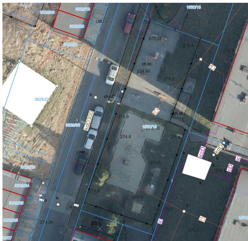
Zdjęcie terenu inwestycji - Strefa Aktywności Rodzinnej przy ul. Pokoju.

4512710-5 - Roboty w zakresie kształtowania terenów zielonych